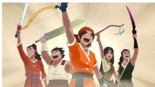
「アルジュンの大冒険～氷の蓮の謎～」 TM & © 2012 Cartoon Network.