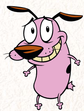
「おくびょうなカーレツジくん」 カーレツジ